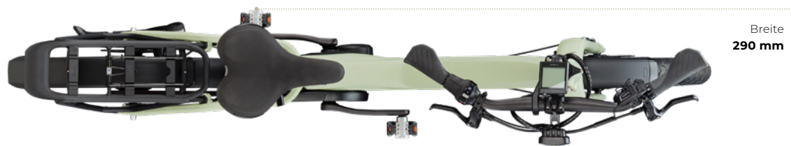
QiO EINS P-5 mit 90° gedrehtem Lenker und eingeklappten Faltpedalen