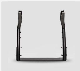
Maxi-Cosi/Baby Autostuhl-Adapterset Explorer 2