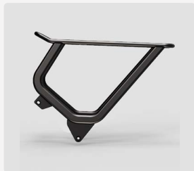
Gepäckträger Explorer 2 mit USB-Port (bis 27 kg belastbar)