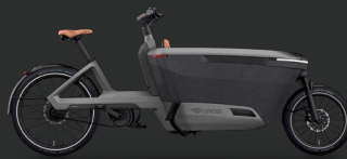
Lovens Explorer 2 S75