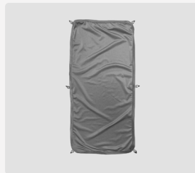
Sonnenschutz Explorer 2