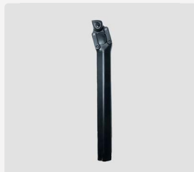
Sattelstütze federnd Explorer 2