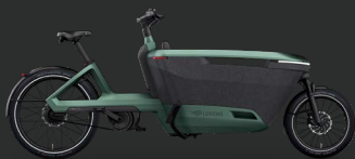
Lovens Explorer 2 S60