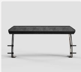
Vorderbank Explorer 2