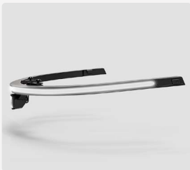
LED-Lichtleiste Explorer 2