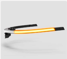
LED-Lichtleiste mit Blinker Explorer 2