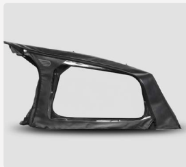
Regenverdeck Explorer 2 (komplett aufklappbar)