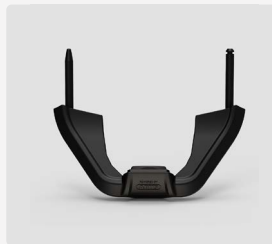
Anti-Diebstahl- Akkuschloss Explorer 2