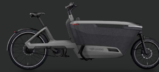
Lovens Explorer 2 S100