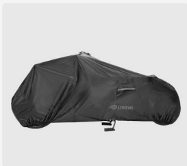
Bike Cover Explorer 2