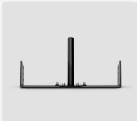
Kindersitz-Adapter Explorer 2