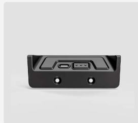
Innenbeleuchtung Explorer 2