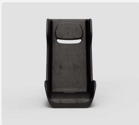
Kleinkindersitz Explorer 2