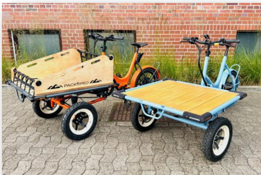
Cargobike Race Bremen 2025