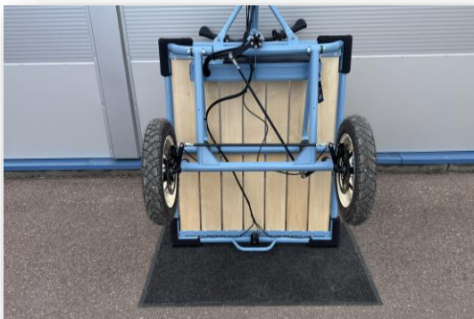
ME Racing 2025