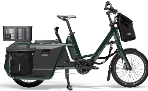
1 x Sitzpolster + Korb Vordere Reling