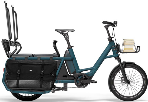
2 x Sitzpolster Reling komplett / klappbar