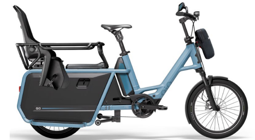
1 x Kindersitz + 1 x Sitzpolster Reling komplett