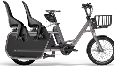
2 x Kindersitz ohne Reling