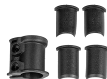
Adapterschelle für absenkable Sattelstützen